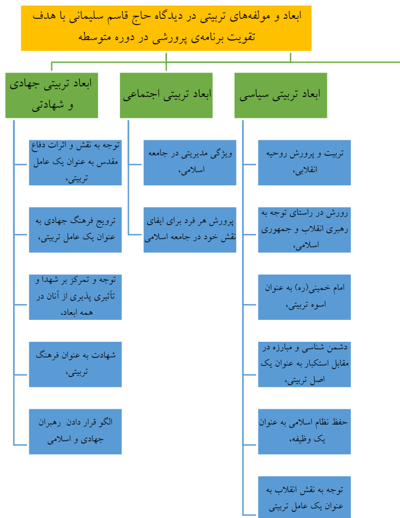
شکل ۱. شبکه مضامین پژوهش